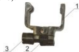
1 – «щеки»; 2 – крепежный винт; 3 – контргайка Рисунок 5

Конструктивно узел крепления к оружию Б состоит из «щек» 1, крепежного винта 2 и контргайки 3 (Рисунок 5).