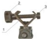
1 – «щеки»; 2 – гайка; 3 – крепежный винт Рисунок 3

Конструктивно узел крепления к оружию Б состоит из «щек» 1, крепежного винта 3 и гайки 2 (Рисунок 3).