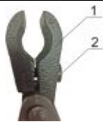
1 – «щеки»; 2 – крепежный винт Рисунок 2

Для установки сошек на оружие необходимо: