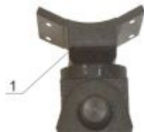
1 – основание

Конструктивно узел крепления к оружию Б состоит из основания 1 (Рисунок 4)