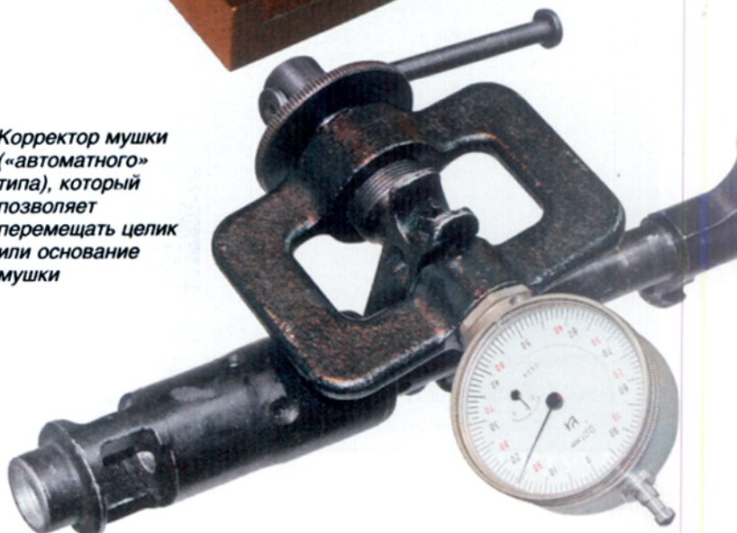
Корректор мушки («автоматного» типа), который позволяет перемещать целик или основание мушки