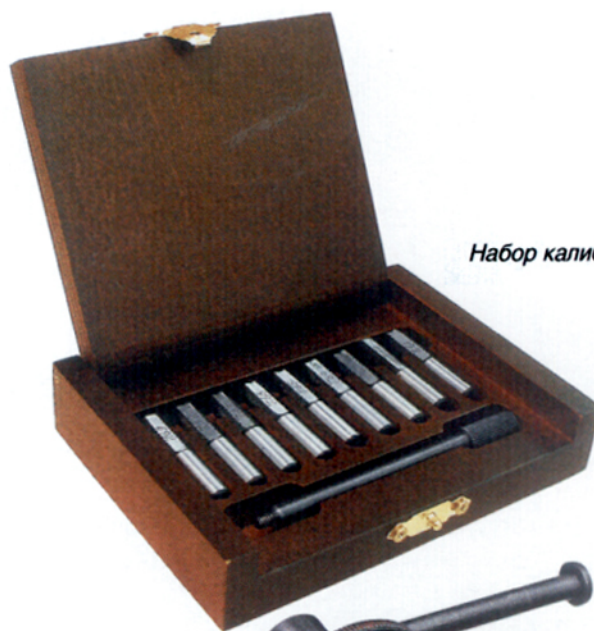
Набор калибров 7,62