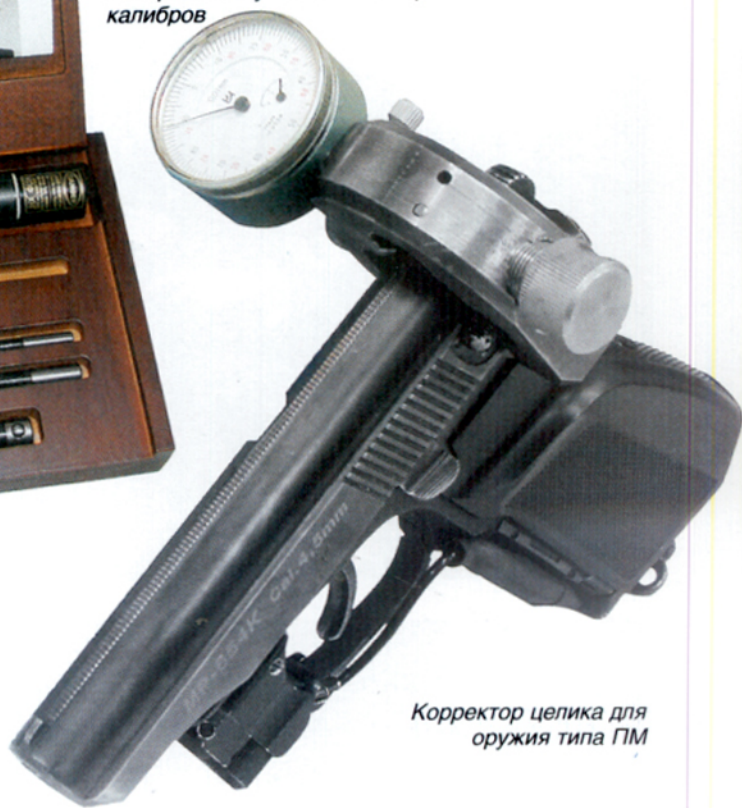
Корректор целика для оружия типа ПМ