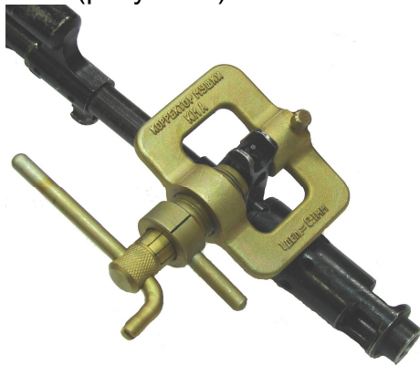
Рисунок 2 – Установка КМА для смещения ползка мушки влево

Для более точного контроля перемещения может быть использован индикатор часового типа (в комплект не входит). Индикатор устанавливается в отверстие Б и закрепляется винтом стопорным 3 (рисунок 1).